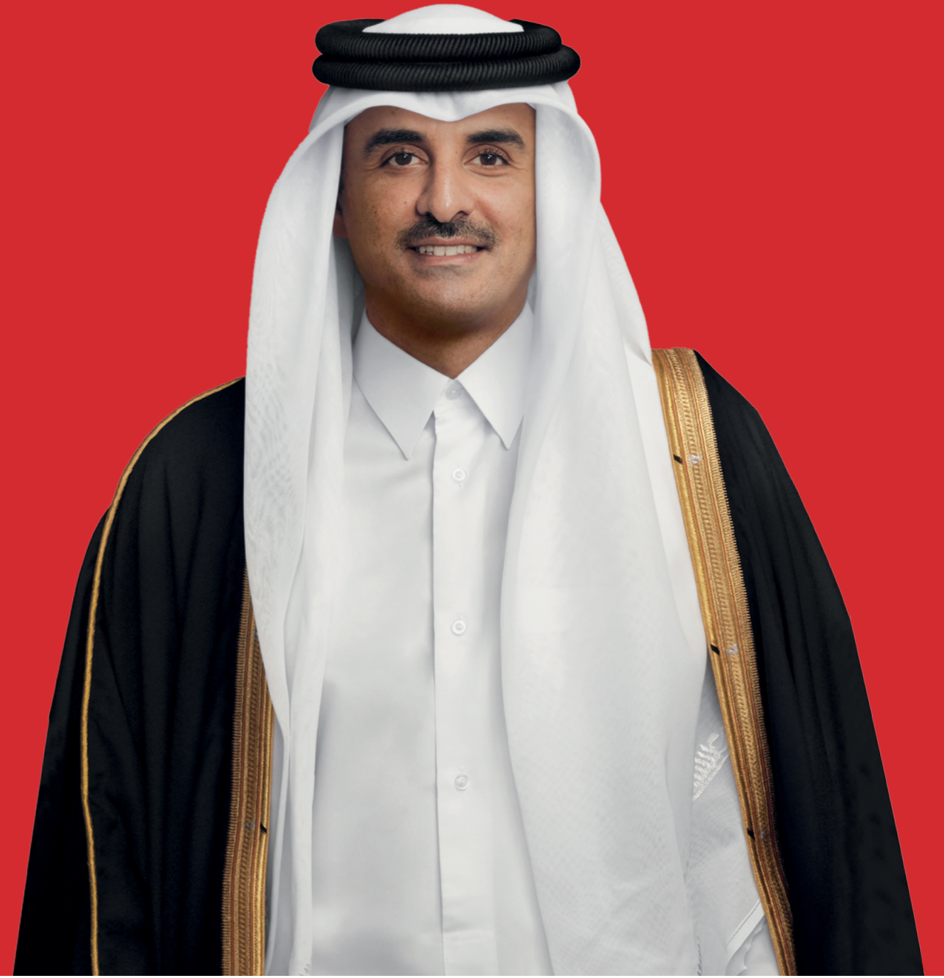
حضرة صاحب السمو الشيخ تميم بن حمد آل ثاني أمير دولة قطر المفدى