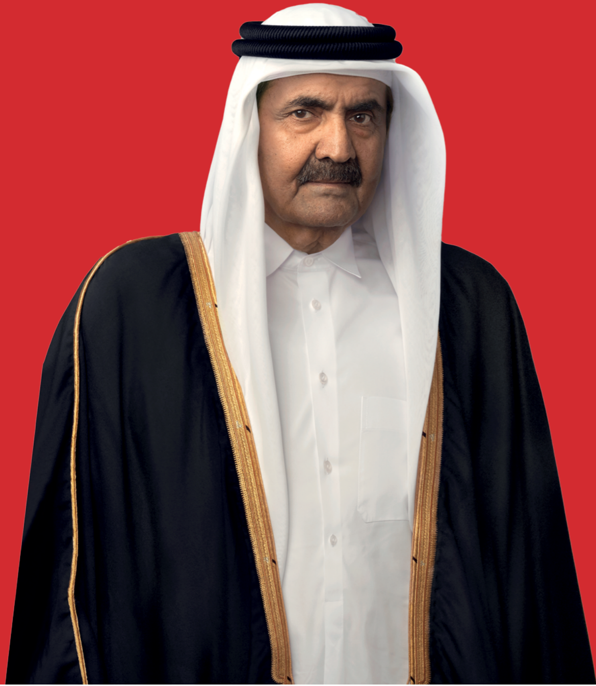
حضرة صاحب السمو الشيخ حمد بن خليفة آل ثاني الأمير الوالد