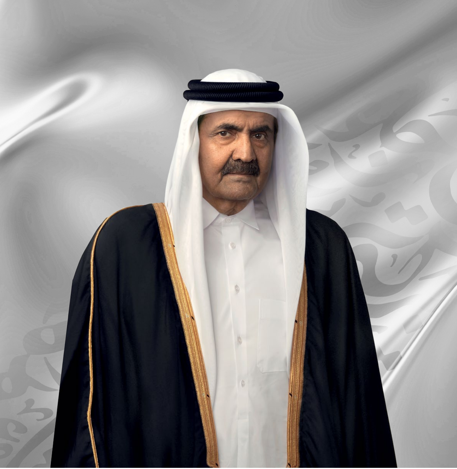
حضرة صاحب السمو الشيخ حمد بن خليفة آل ثاني الأمير الوالد