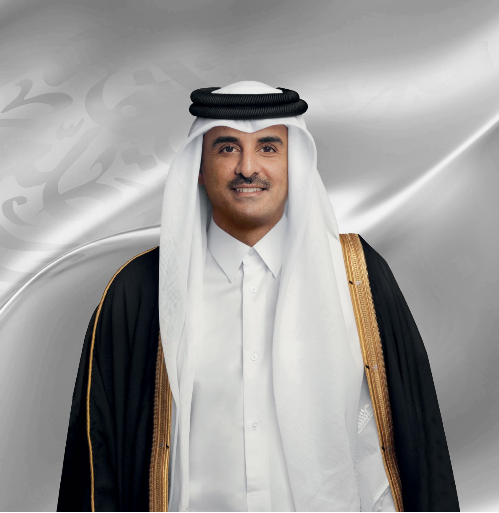
حضرة صاحب السمو الشيخ تميم بن حمد آل ثاني أمير دولة قطر المفدى