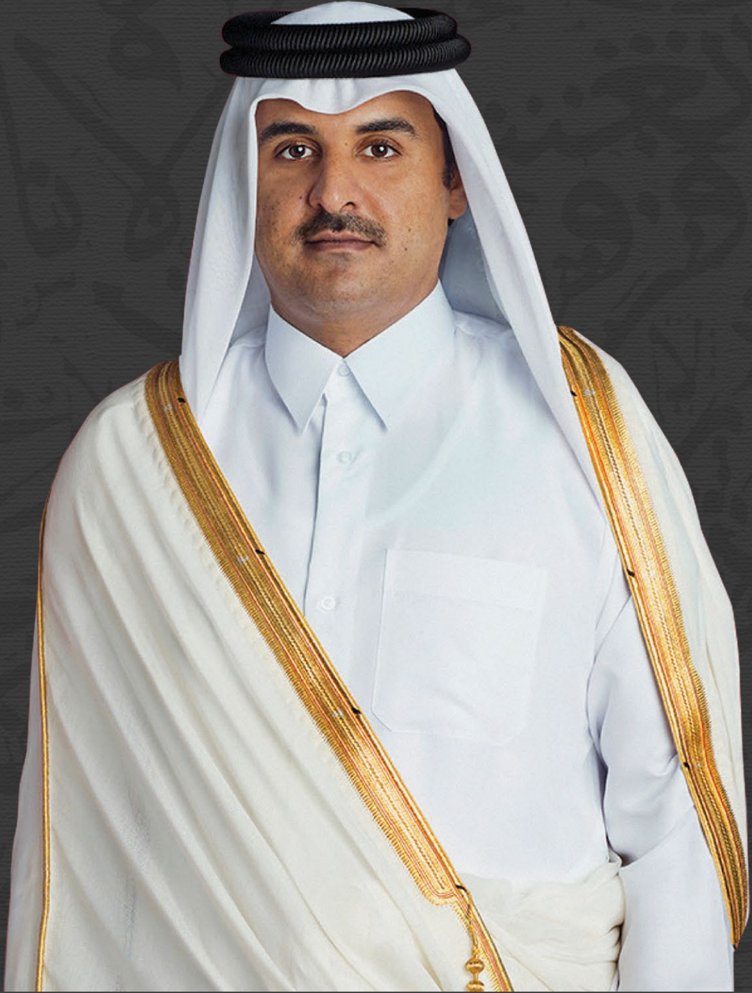
حضرة صاحب السمو الشيخ تميم بن حمد آل ثاني أمير دولة قطر المفدى