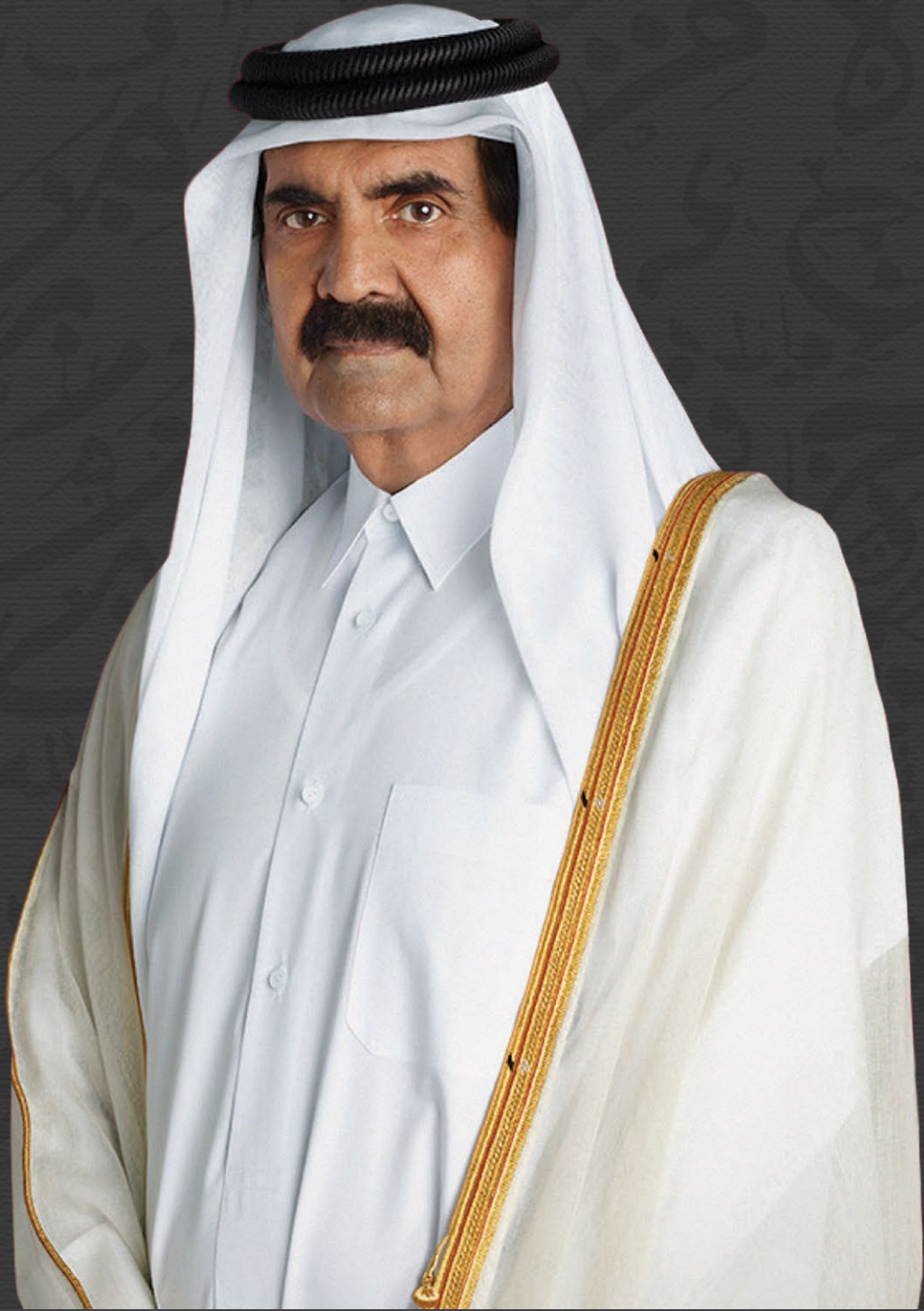
حضرة صاحب السمو الشيخ حمد بن خليفة آل ثاني الأمير الوالد