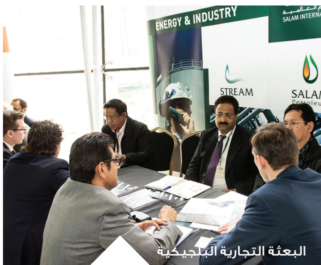
البعثة التجارية البلجيكية