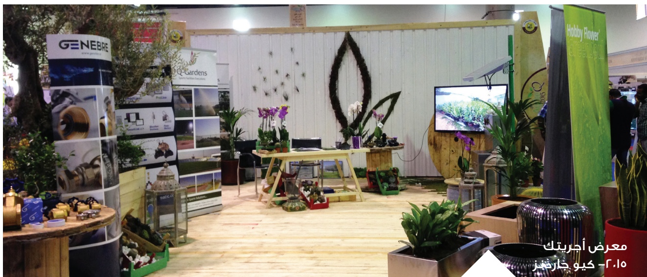
معرض أجريتك ٢٠١٥ - كيو جاردنز