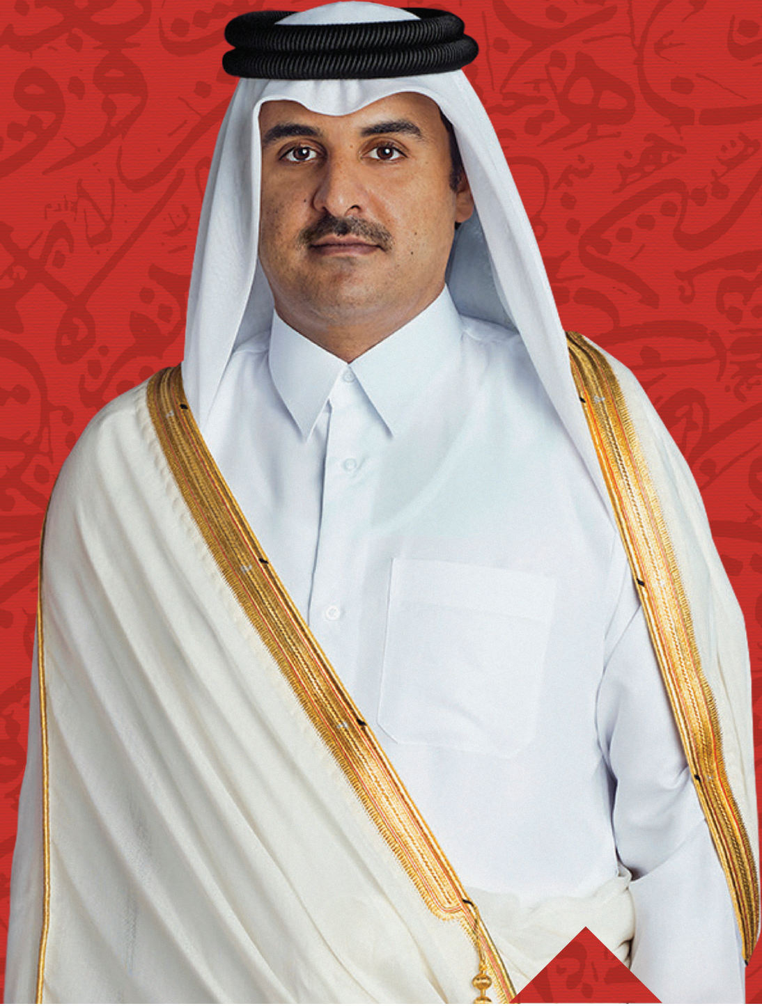
حضرة صاحب السمو الشيخ تميم بن حمد آل ثاني أمير دولة قطر المفدى