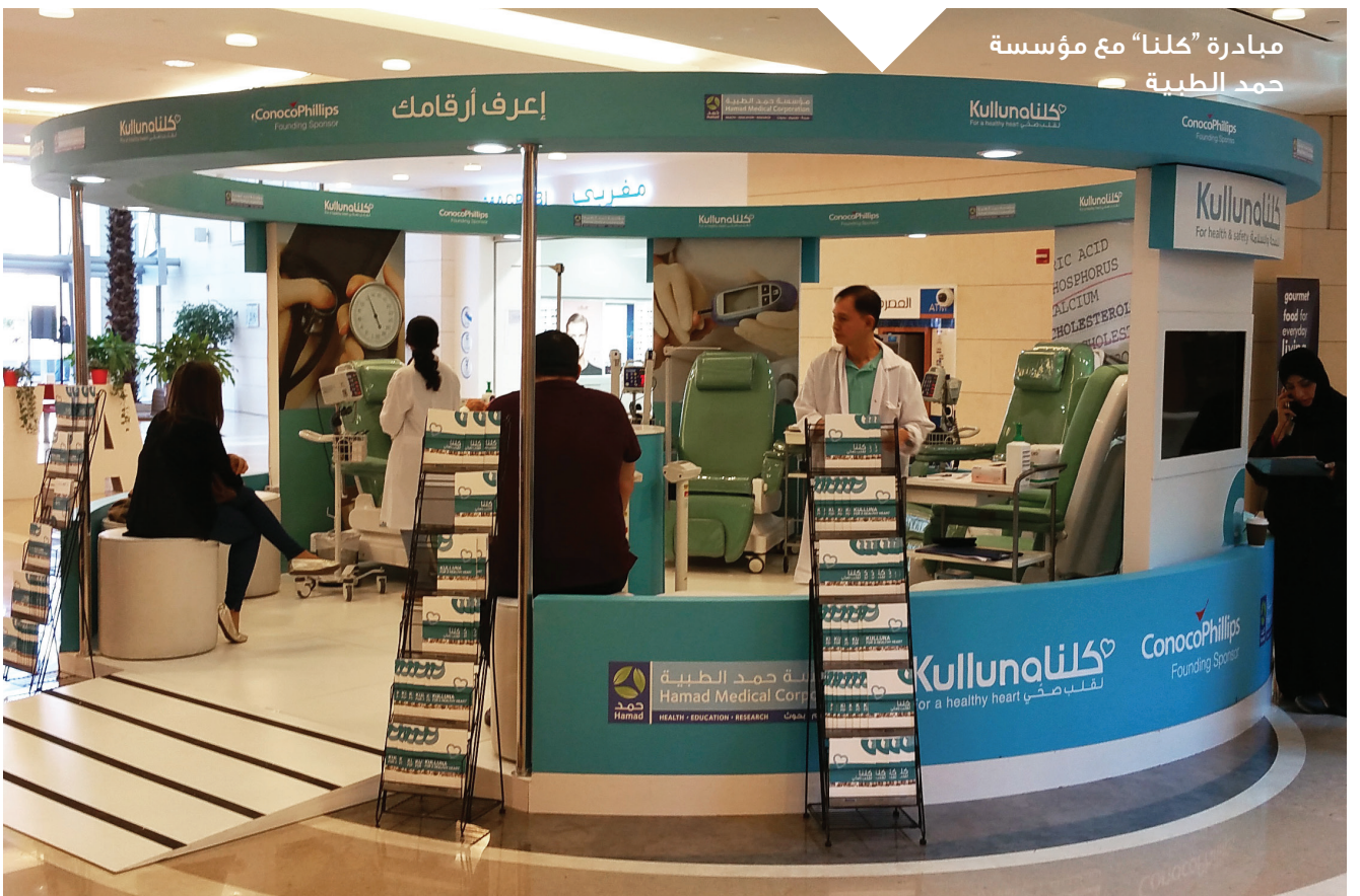
مبادرة "كلنا" مع مؤسسة حمد الطبية