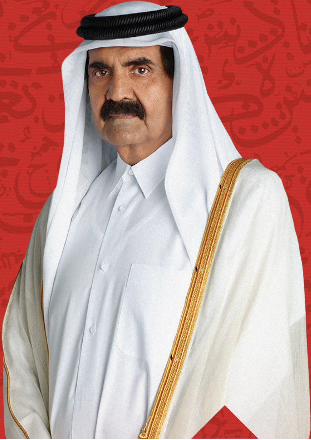
حضرة صاحب السمو الشيخ حمد بن خليفة آل ثاني الأمير الوالد