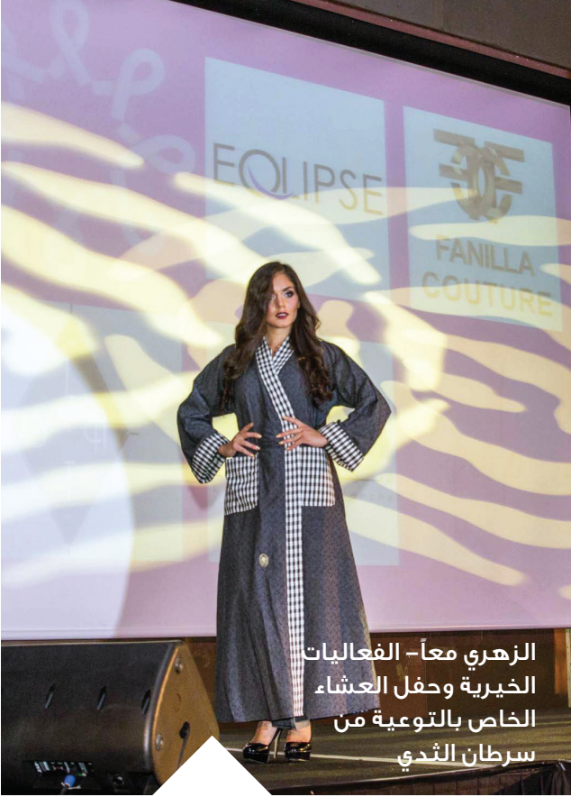
الزهري معاً- الفعاليات الخيرية وحفل العشاء الخاص بالتوعية من سرطان الثدي