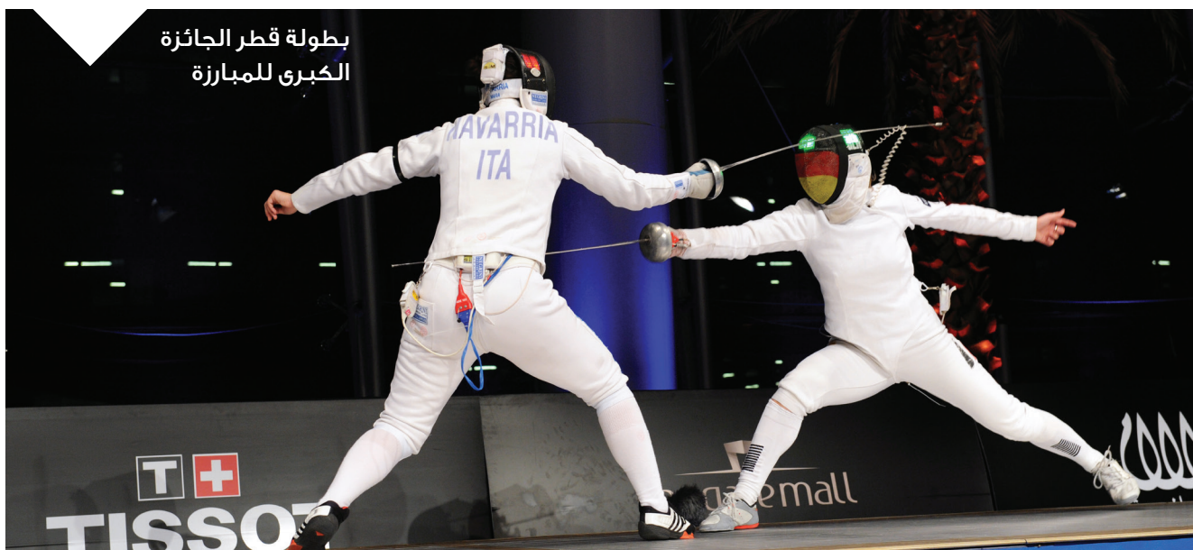
بطولة قطر الجائزة الكبرى للمبارزة