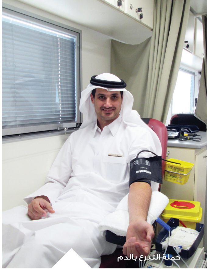
حملة التبرع بالدم