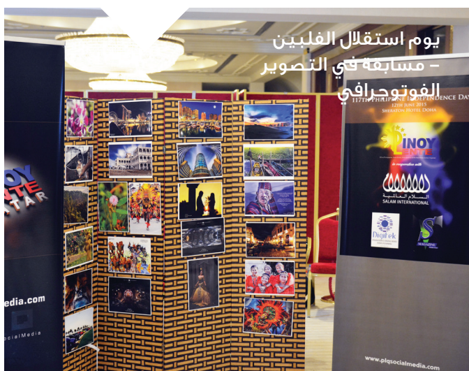
يوم استقلال الفلبين - مسابقة في التصوير الفوتوجرافي