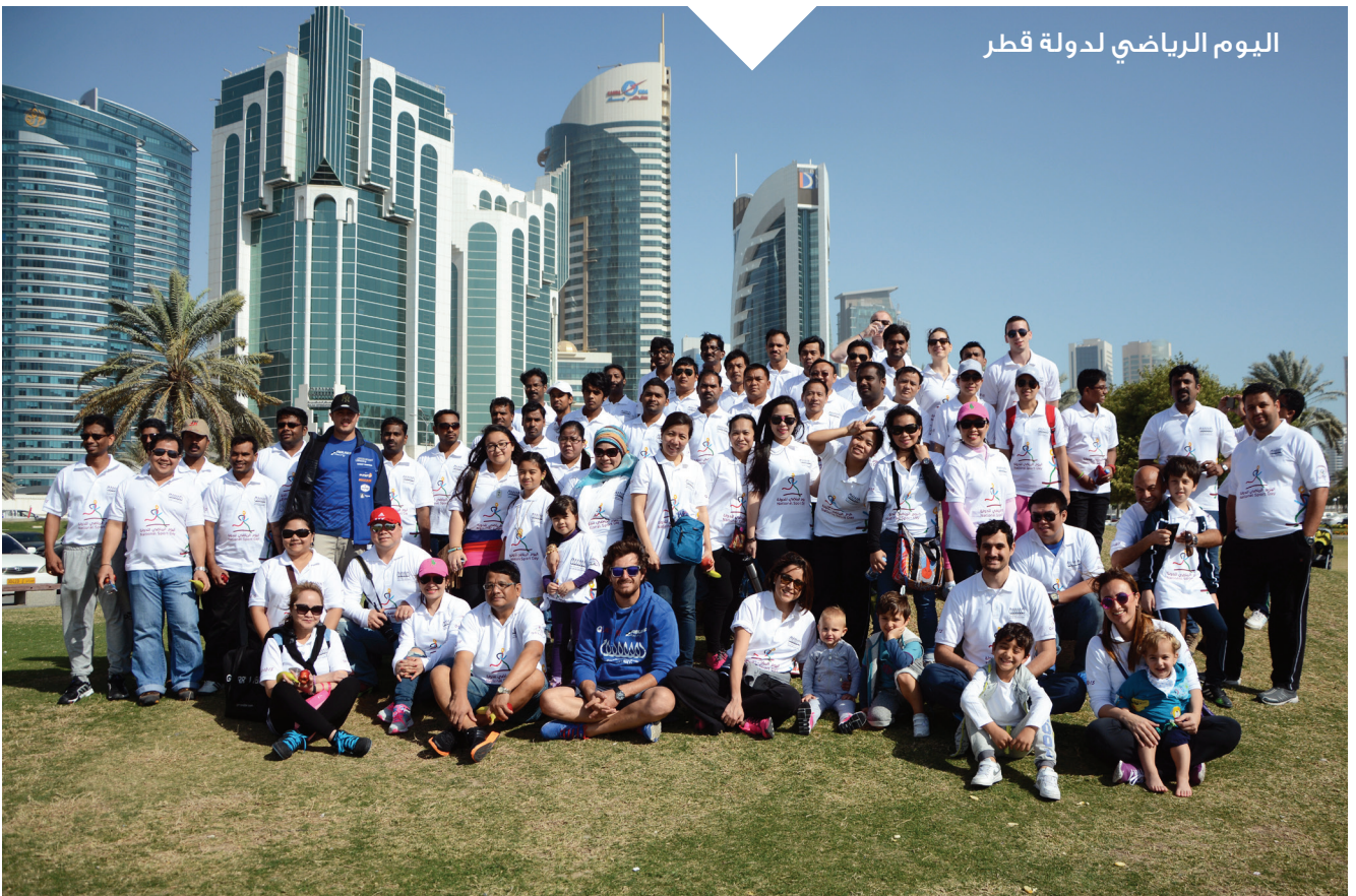
اليوم الرياضي لدولة قطر