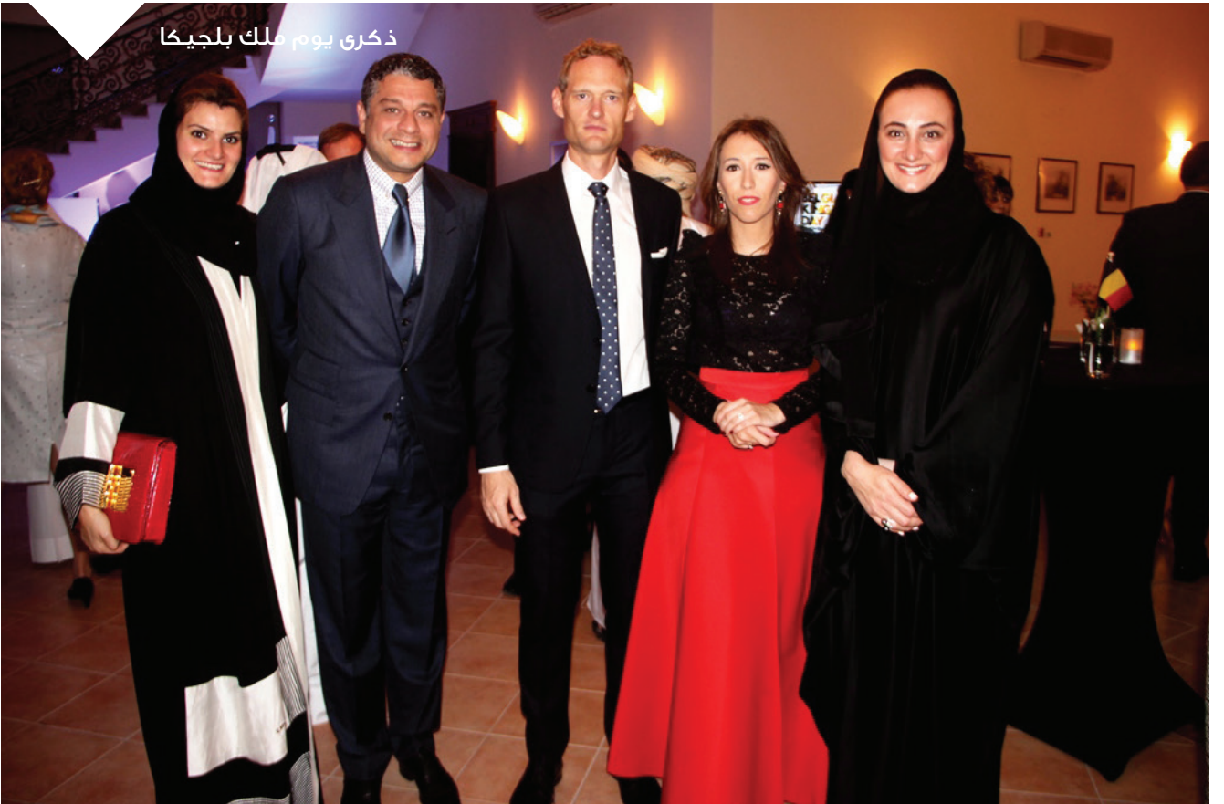
ذكرى يوم ملك بلجيكا