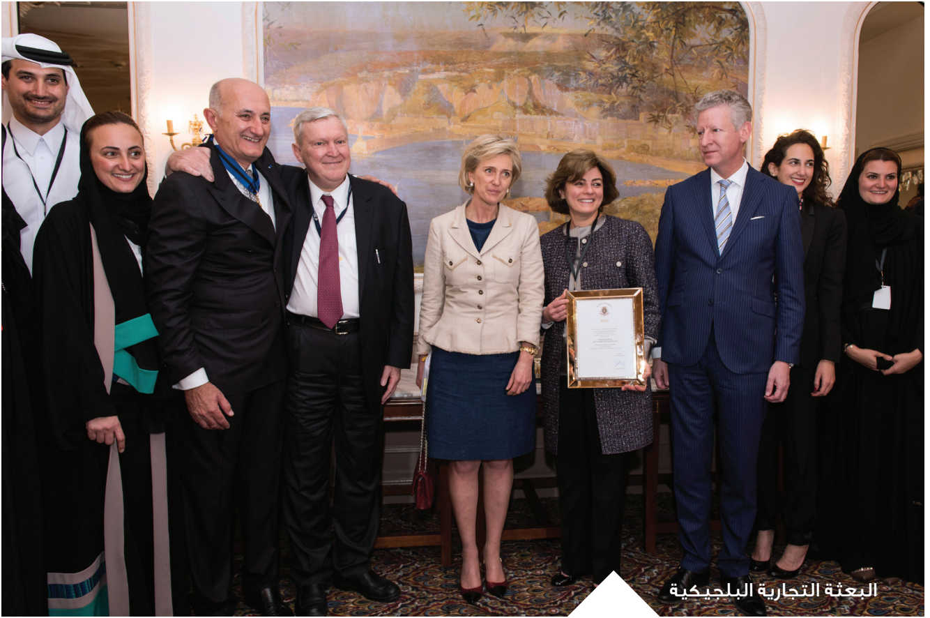
البعثة التجارية البلجيكية