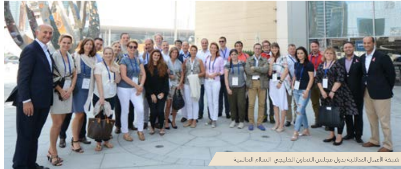
شبكة الأعمال العائلية بدول مجلس التعاون الخليجي-السلام العالمية

٥٠ دولة من أرجاء العالم، يتولى الاتحاد القطري تنظيم بطولة قطر الجائزة الكبرى منذ عام ٢٠٠٥ وذلك بالتعاون مع الاتحاد الدولي للعبة، وقد أسعدنا في السلام العالمية أن نفتح أبواب ذي جيت مول من أجل استضافة الأدوار النهائية.