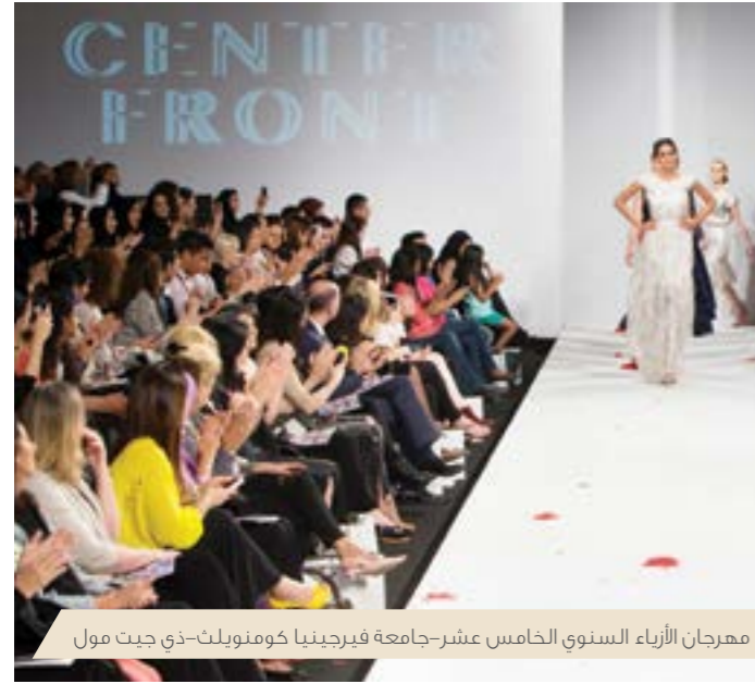
مهرجان الأزياء السنوي الخامس عشر-جامعة فيرجينيا كومويلث-ذي جيت مول