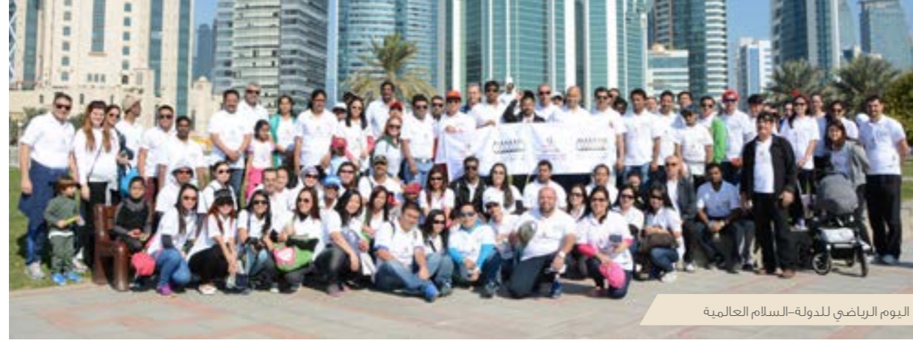
اليوم الرياضي للدولة-السلام العالمية