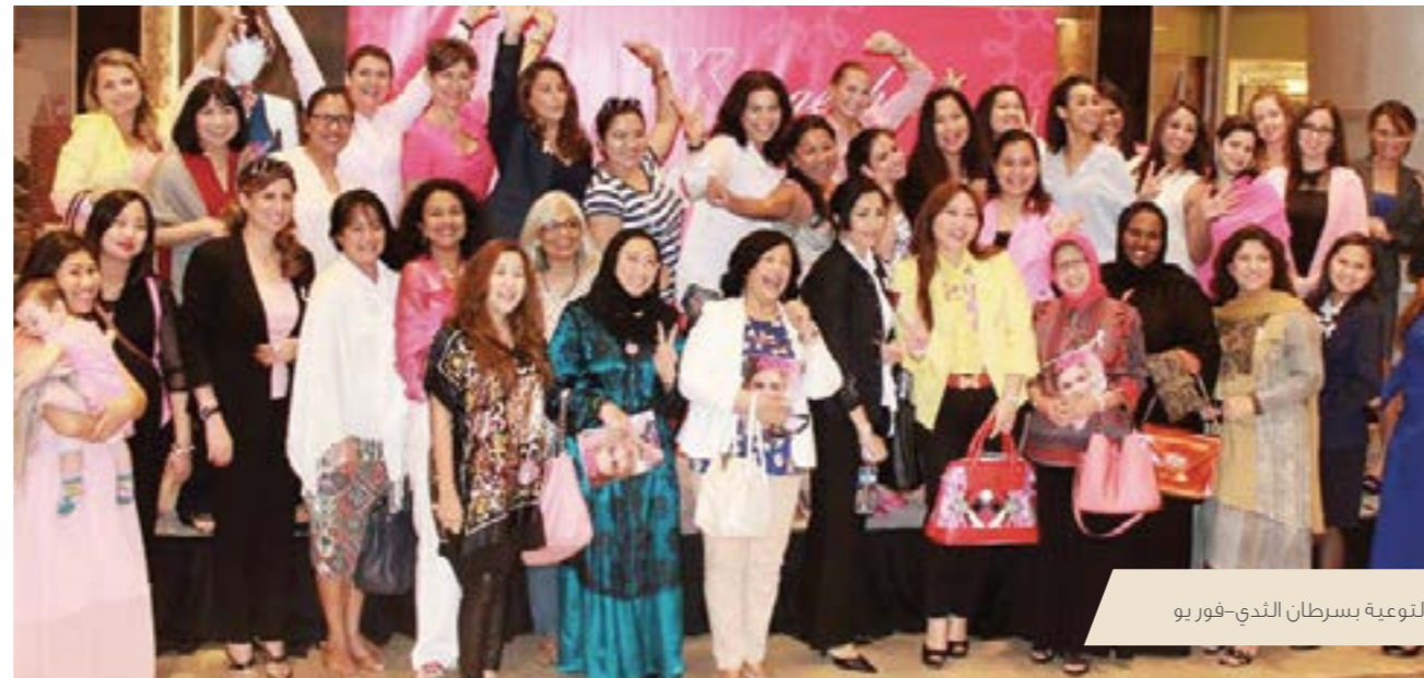
التوعية بسرطان الثدي-فور يو