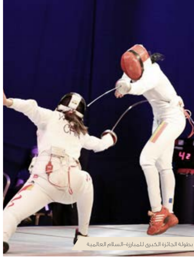
بطولة الجائزة الكبرى للمبارزة-السلام العالمية