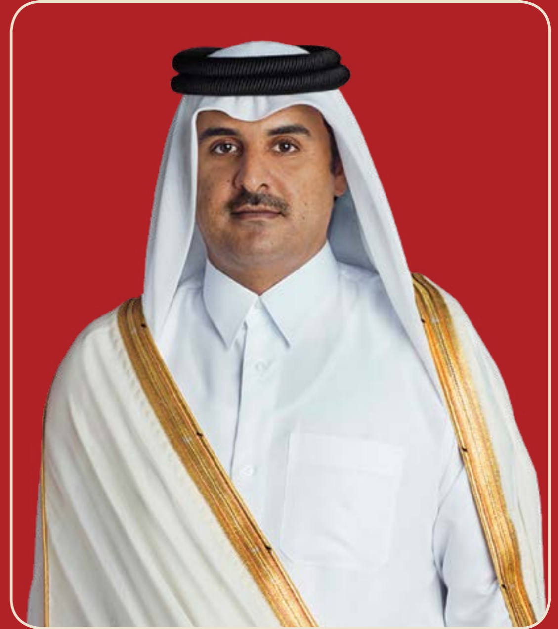
حضرة صاحب السمو الشيخ تميم بن حمد آل ثاني أمير دولة قطر المفدى