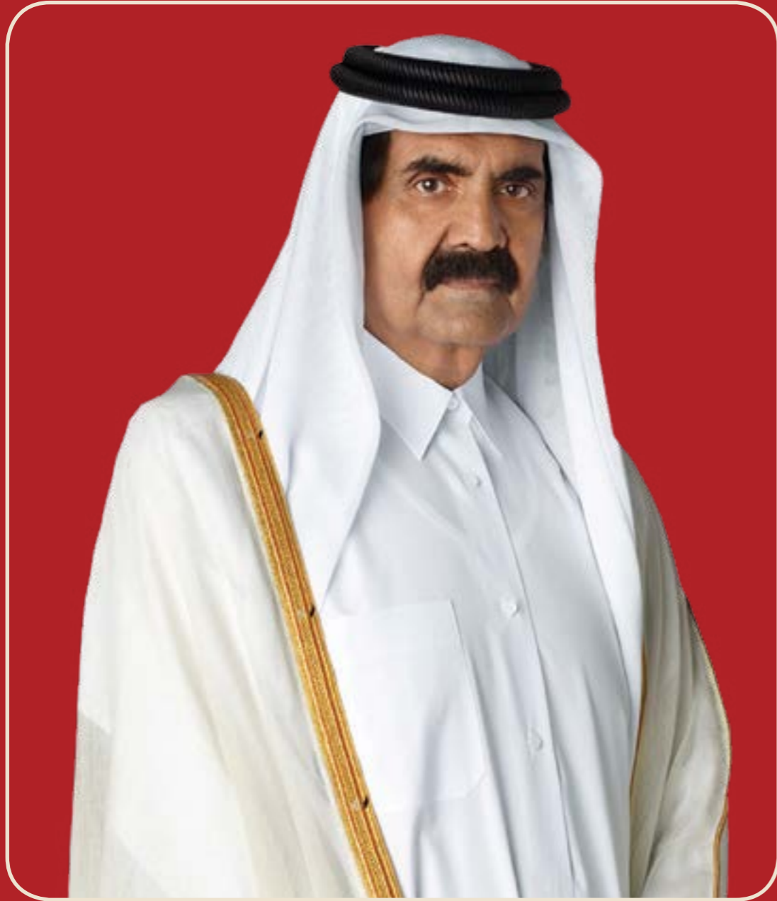
حضرة صاحب السمو الشيخ حمد بن خليفة آل ثاني الأمير الوالد