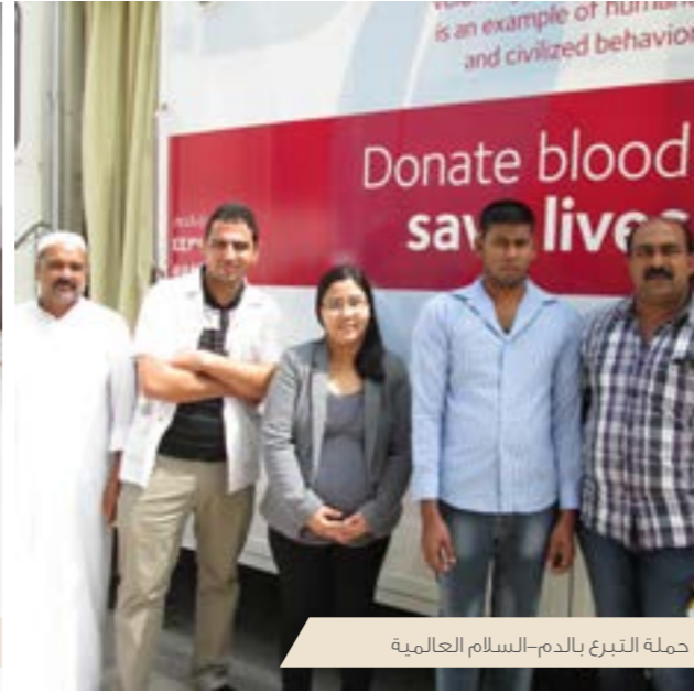
حملة التبرع بالدم-السلام العالمية